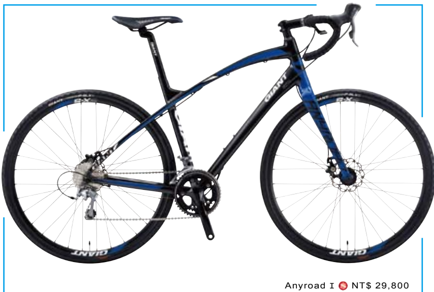
Anyroad 1 ● NT$ 29,800