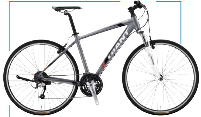
Roam萬能運動越野車保有越野性，但又有舒適與速度，供車友入門越野。入門款ROAM2 ● NT$ 13,800

跟著買，但其實折疊車適用於通勤、接駁、平路 10 公里的騎乘，於是這些消費者很可能就不會體驗到更多騎車樂趣，進而失去對自行車騎乘的熱情。所以現在捷安特希望可以為消費者省去摸索的過程，讓消費者一開始就能很簡單的體驗到運動、健身的樂趣，下一步就會再選購更進階的車款。