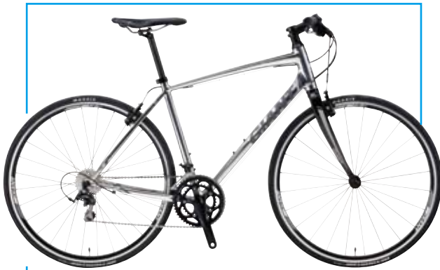
Escape RX 0適合城市樂活，拋光灰塗裝亮眼時尚。 ● NT$ 29,800