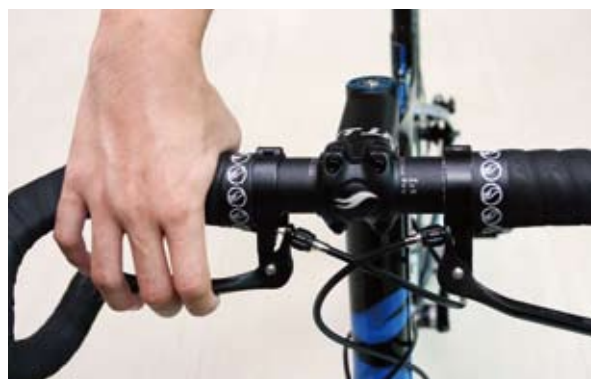
▲獨特的4點煞車，在操作容易，不管是握在上把位、煞把位或下把位，都能有效按壓煞把。

在車架幾何方面，以最適自行車運動的騎乘姿勢，設計全新最佳運動的車架幾何，頭管較高，座墊與把手高低差較小，讓車友騎乘更舒適，操控安心。全新設計