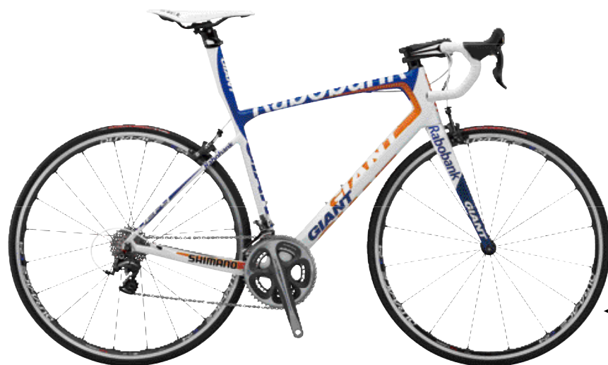
◀ Defy Advanced SL夾帶著優異的舒適性、高剛性與輕量化，進軍2012春季古典賽。