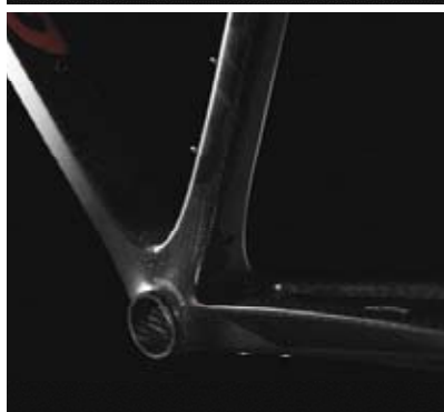
▲TCR Advanced SL頂級碳纖維公路車架採用全碳纖維壓入式五通與上頭管，整體重量邁向輕羽化境界。