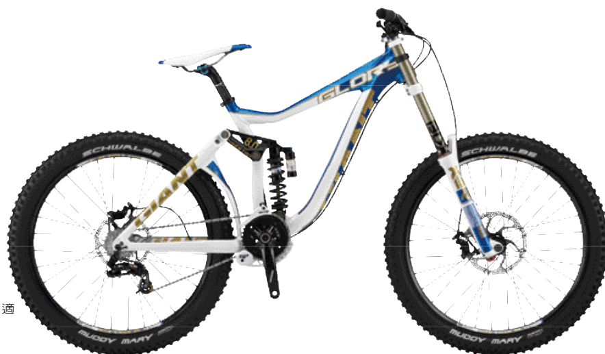
▶ Downhill世界盃冠軍戰駒Glory 0適合挑戰自我、邁向極限的車友。