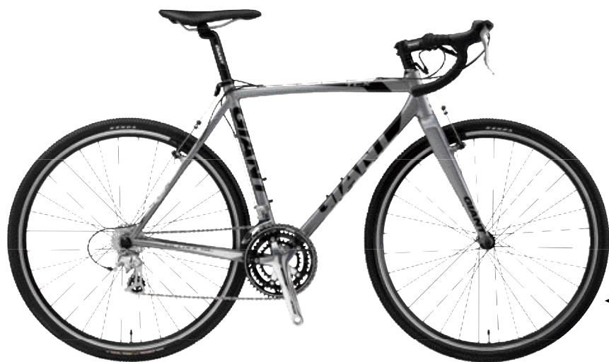
◀ Cyclo-Cross市場增溫，為了讓更多車友們輕鬆入手，Giant新增一輛入門車款TCX 3，建議售價NT$ 19,800。