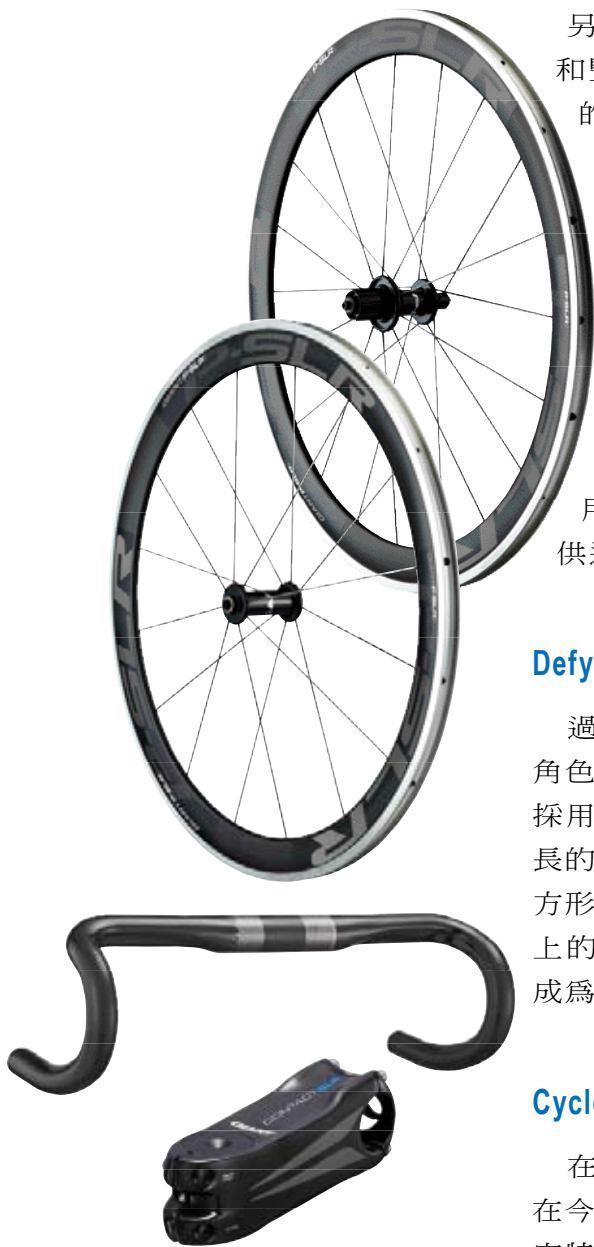
▲ Giant 旗下車款大量地採用 Giant 輪組、豎管和車把手等零件，讓整車性能如虎添翼。

另一方面，2012年旗下車款大量採用 Giant 輪組、車把手和豎管等零件，透過相同的設計概念，不但可以營造品牌的整體印象，車架與零件的性能亦可產生極佳的「驚奇互動」，讓整車性能如虎添翼；其中像是 P-SLR1 AERO 碳纖維鈦合金複合式輪組就不難在一級車款見到它的蹤影，它的輪框寬度為 21mm，可增加輪胎抓地力，低風阻效能銳不可擋，加上隱藏式 Nipple 設計，重量 1,660g；還有 Contact SLR 車把手，採用碳纖維材質，不但符合人體工學設計，搭配的調整刻度讓你輕鬆定位；Contact SLR 豎管也是不容錯過的焦點，與 Overdrive2 系統「齊心合力」達到絕佳的操控性，它同樣採用碳纖維材質，可以提升 30% 剛性，並且提供多種尺寸供選擇。