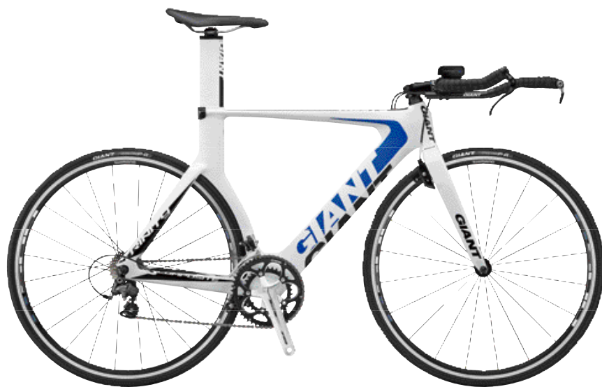
▲為了讓更多民衆加入自行車大家庭，熱門車款新增價格親民的入門款式。圖為Trinity Composite 2，建議售價NT$62,800。