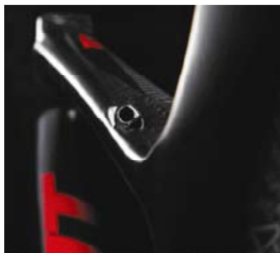
▲Giant隱藏式走線特別增加導管藏身於車架，更換管線更有效率與方便。