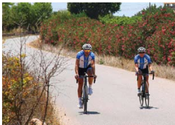
▲一定要自己實際試乘看看，才能體會車款性能，Let's Go!