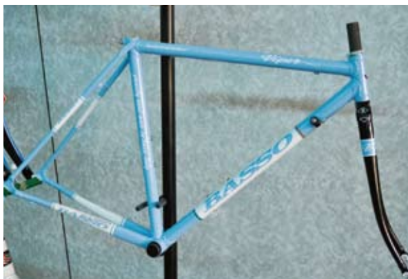
▲Basso鋼管車講究Lug銅焊技術，精緻工藝贏得台灣車友的芳心。