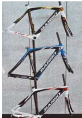
▲Astra為Basso的第二級車架，秉持著優異的性能讓它成為2010年環義賽與環中國賽的冠軍車種。