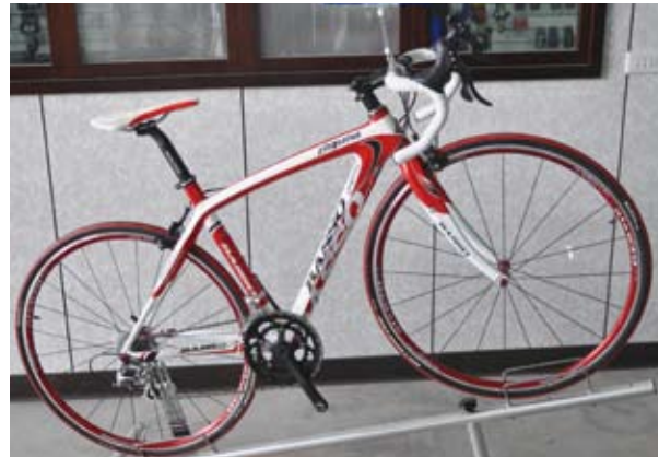
▲2011年Basso車款的塗裝以大膽鮮豔的設計亮相，本圖為第三級車架 Laguna。