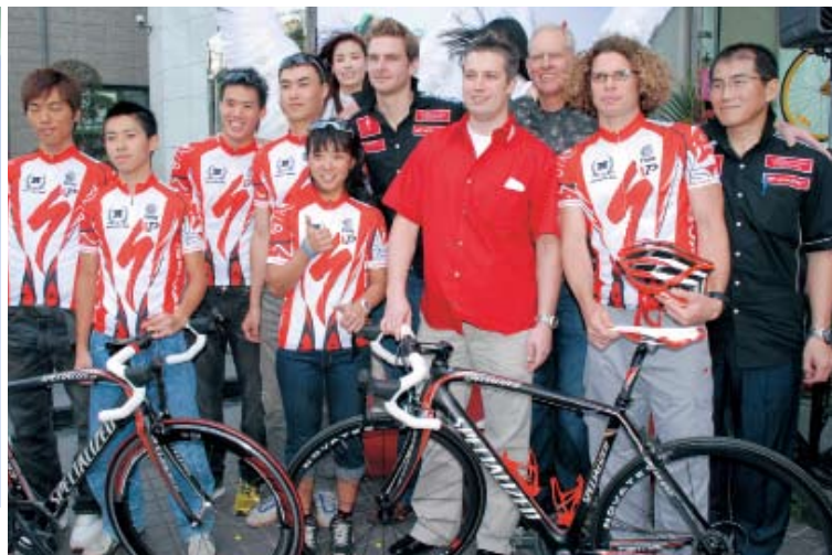
▲ Specialized 高層與台灣車隊主要成員合影。