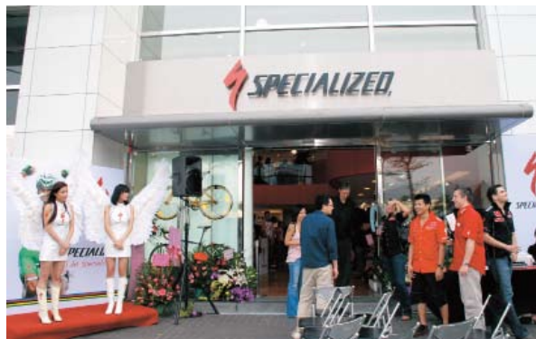
▲位於內湖科技園區瑞光路上的概念店相當顯眼。

訝，且車友的座騎與裝備都很專業高檔，讓他決定要耕耘台灣這塊市場。Mike 強調，Specialized 概念店與眾不同之處，在於店內的銷售人員都必須通過 Specialized 自行車設備大學 (Specialized Bicycles Components University, SBCU) 的訓練，如此一來可讓員工根據自身的騎乘經驗，幫客戶挑選最適